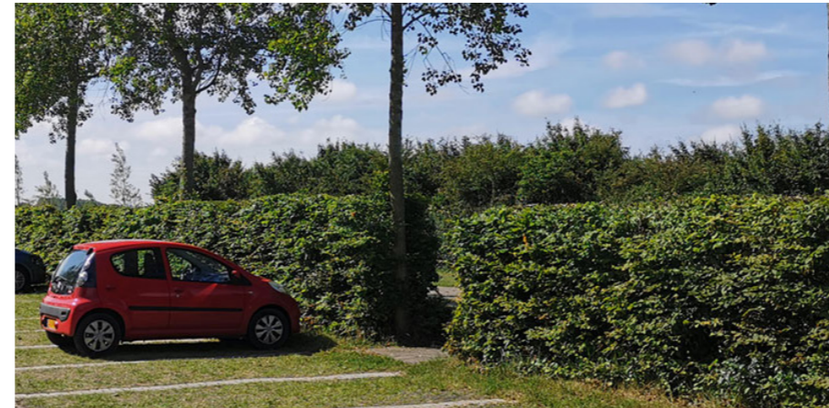
Groene omheining parkeerplaats